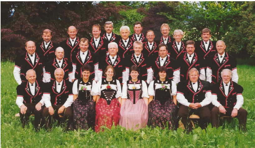
Erste und einzige CD-Aufnahme im Jahr 2000