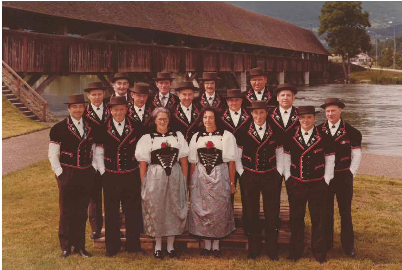
Jodlerfest Wangen a. Aare 1979