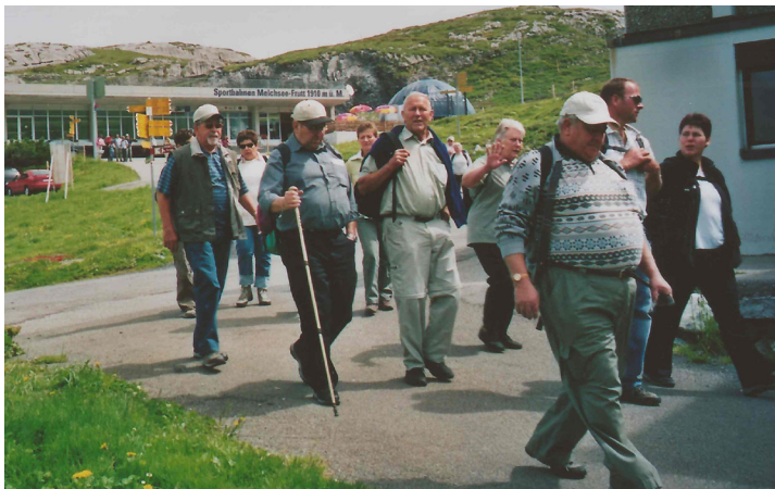
2007: Chörli-Reise Melchsee Frutt