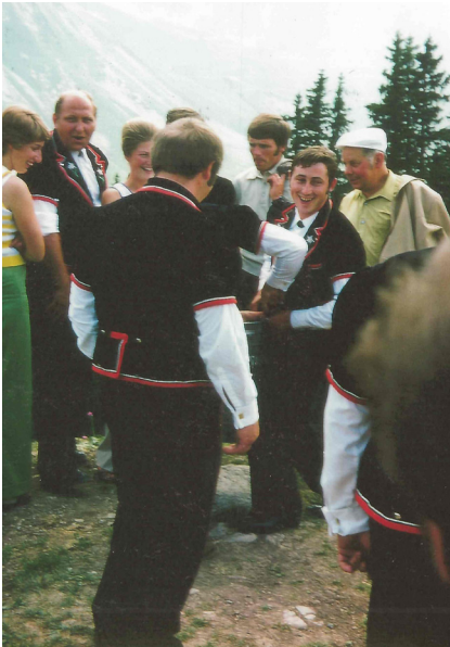
Am Hans siner Hose wärde wider gflickt

Früsch u munter reiset ds Jodlerchörli Diemerswiu mit em Car uf Beckeried, natürlech im Mutz, wi das dennzumau noch isch üblich gsy. Mit dr Gondelbahn sy mer schnäu uf dr Klewenalp obe, u übermüetig wi mer sy, probiere mer zersch emau di Chinderspiiuigräät uus, wo dert ufgesteut sy. Bi der Reckstange isch es du haut passiert: Mir rütsche plötzlech die wäärschafte halbllynige Hose über d Chnöi abe. Es het es Riiseglächter gä ringsetum, u für mi säuber isch es oberpiinlech gsy. Schnäll zien i di Hose wieder ueche u luege, warum das Malheur passiert isch. Ungsicheret, ohni Hosetregger oder Gurt, het der Hose-ringge di Strapaze nid möge ebha u isch usgrisse. Mit eme Stei un em Abfauchübeu aus Underlaag han i dä Schade wider chönne repariere. Mit grööschter Vorsicht mynersyts hei di Hose när dr Räschte vo üser Reis überstande!